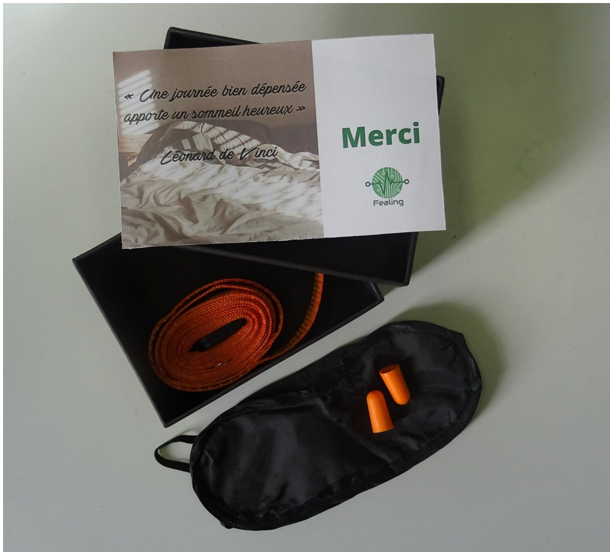
Box ollie composé du support amplificateur

En participant à ce programme de recherche, vous recevrez un support amplificateur aimanté à installer autour de votre matelas et l'application smartphone Ollie en version bêta qui enregistrera sans contact vos signes vitaux et ronflements pendant la nuit. Le lendemain matin, notre technologie interprétera votre sommeil et progressivement nous intégrerons des solutions pour mieux dormir.